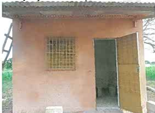
Le dépôt pharmaceutique terminé