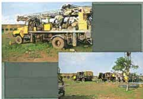
Mise en place d'un des forages